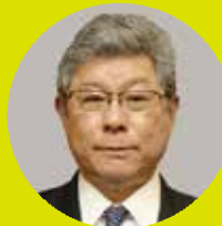
パンツ高木 (高木毅 国対委員長)