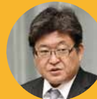
パーベキュー萩生田 (萩生田光一 政調会長)